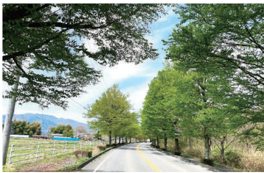
▲那須ガーデンアウトレットから那須に向かう県道53号線沿いの街路樹（かつらの木）の若葉が一斉に開きました。春から初夏に向けてやわらかい黄みがかかった新緑は爽やかな気持ちにさせてくれます。

開発会社「東昭観光開発（株）」の破綻を受け、水道や道路といった「生活の生命線」を守るため、会員による互助機関として、建物会員10万円、土地会員3万6千円を会費とする東昭自治会が設立されました。設立後には那須水害や東日本大震災などの災害に見舞われ、その都度、災害積立金制度等の改定を行ってまいりましたが、設立から五十余年を経た現在においても、なお同額の会費で運営が続けられており