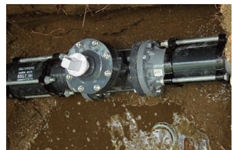
▲清溪苑仕切弁交換 After <ゲートバルブを更新する事により今後のメンテナンスが簡単になります。>