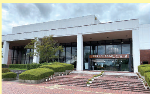
会場：那須塩原市黒磯文化会館

●出席される方は同封の出席票（はがき）にご記入の上で事務局まで返信をお願いします。また、当日は受付の混雑防止のため、後日別送する出席受付票（はがき）を必ずご持参くださり受付に提出して下さい。