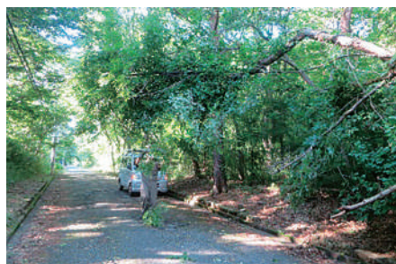
▲枝打ち作業 ＜車の通行を妨げない範囲で事務局により枝打ち作業を行います＞