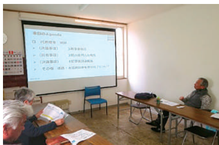
▲理事会での審議風景 <3期は定期理事会を4回開催して各議案の審議・決議を行いました>