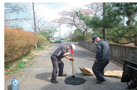
▲道路の凹凸修繕作業 ＜軽微な修繕は経費節約のため、事務局によるトライアルを実施中。＞