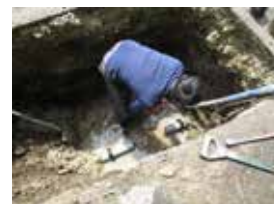
青木で行った漏水修理。自治会内の分譲地では、どこで起きても適切に対処します。