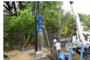
五峰苑の井戸掘削の工事現場。新たな工事は大がかりなものとなります