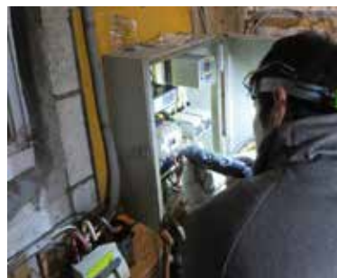
小深堀の井戸、マグネットスイッチ交換、法人になっても修繕は欠かせません。

令和元年9月発行の会報・臨時号において一般社団法人化についての記事を掲載以降、都合6回にわたり法人化への記事でご説明を行ってまいりました。令和3年8月発行の会報73号では法人化のアンケートを行い、回答者の半数以上の会員に必要性を理解していただき、その結果は本年3月に発行した会報・特別号で報告しております。過去の自治会たよりはホームページ上に掲載しておりますので、紙面をお持ちでない方はこちらからも内容をご確認できます。