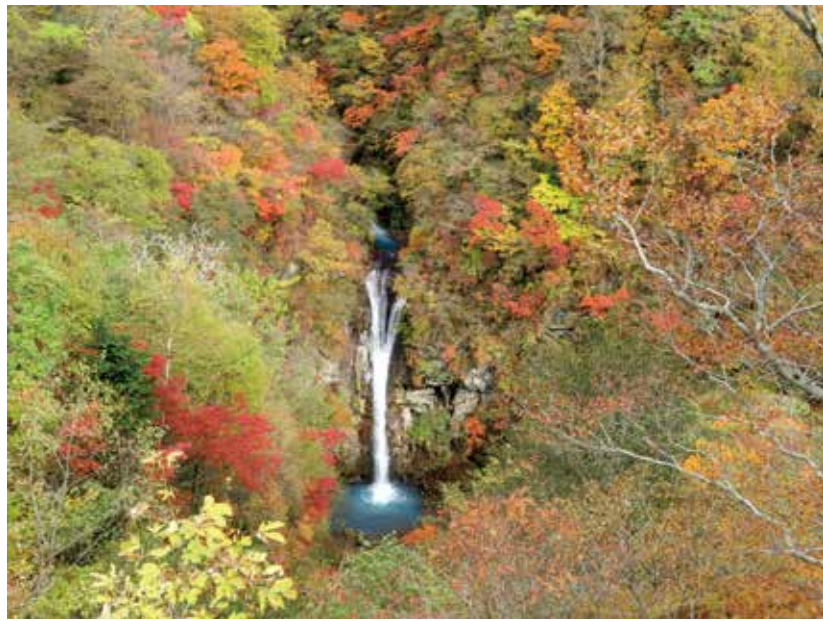
駒ヶ滝：那須湯本から那須街道を北上し、大丸・八幡間の途中から北温泉方面に向かった場所にある滝。別名を「駒止の滝」ともい、'那須第一の滝'と言われています。那須平成の森の開園に伴って観瀑台が整備され、その姿を一望できるようになりました。

ます。高齢者にはまだまだ従来の対策であるワクチン接種・三密回避・マスクの着用・手洗対策の継続が求められております。この時期は、コロナだけでなく暑さへの配慮も欠かせませんが、何卒ご自愛のほどお願い申し上げます。