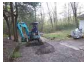
玉取平で行った道路補修。補修はあくまでも現況への回復が基本です。

●除草剤散布時期の前倒し(5月下旬)とアルバイト人員の確保。●部品の納期遅れ対策として、年度末計画ではなく、上期中に準備を行う。●土地会員芳名板のチェックと準備