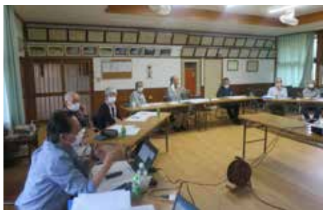
理事会でも討論を重ね、将来も安定して事業運営できることを考えて会費の改定案を決めました。