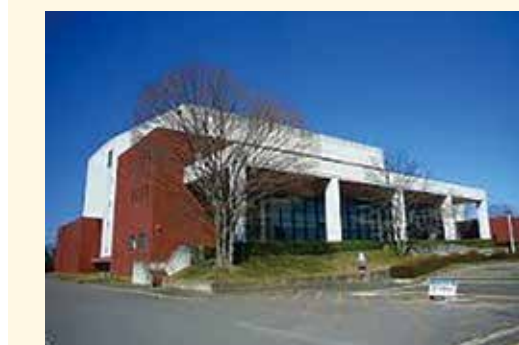
会場:大正堂くろいそみるひいホール (旧・那須塩原市黒磯文化会館)小ホール

2. 水道施設への立入り禁止等の仮処分命令申立てでは、東昭自治会以外の何人も共益施設に関与できない。以上の決定が裁判所から下されました。これにより会員の方々の不安がいちおうに払拭され安堵されたことと思えます。